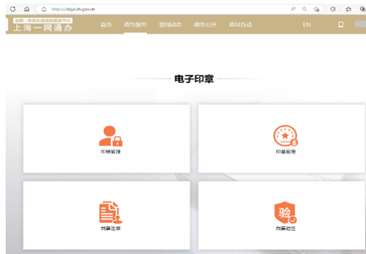
图 2：上海一网通办（页面图）